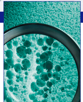
Atmungsaktive, feuchtigkeitsregulierende Zellstruktur, die dem Aufbau eines Naturschwamms gleicht.

Matratzen BÜLTEX® von SCHLARAFFIA ist die erfolgreichste, neueingeführte Matratzentechnologie der 90er Jahre. Das Geheimnis des Erfolges liegt in den außergewöhnlichen Materialeigenschaften. Einzigartig in Europa ist das patentierte und preisgekrönte Herstellungsverfahren mit herausragenden Resultaten in den Bereichen Komfort, Klimatisierung und Ökologie. Auf dieser Basis hat SCHLARAFFIA jetzt BÜLTEX® plus entwickelt. Mit revolutionär neuen Pluspunkten für eine perfekte Körperunterstützung und gesunden Schlaf.